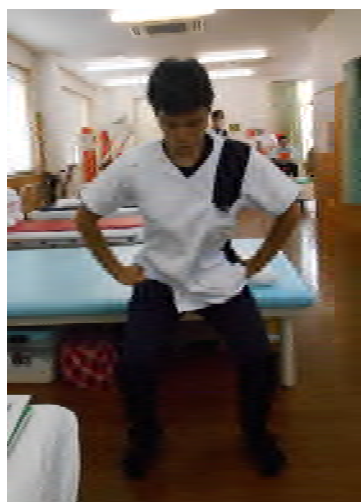
正面から見た場合