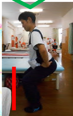
横から見たの場合