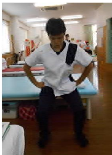
正面から見た場合